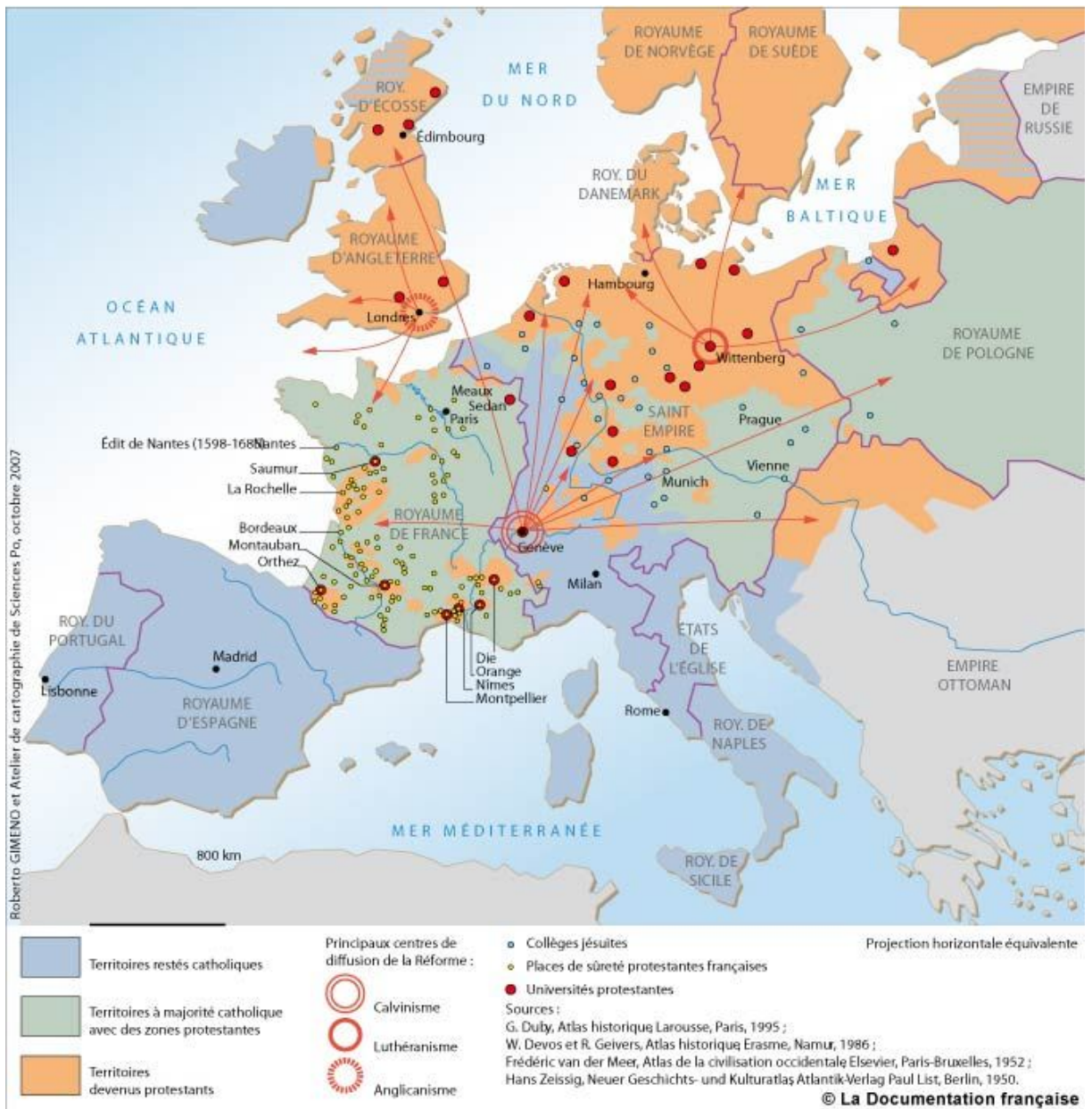
La Réforme protestante aux XVI e -XVII e siècles